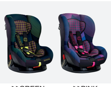
>>GREEN HYPERWAVE >>PINK HYPERWAVE