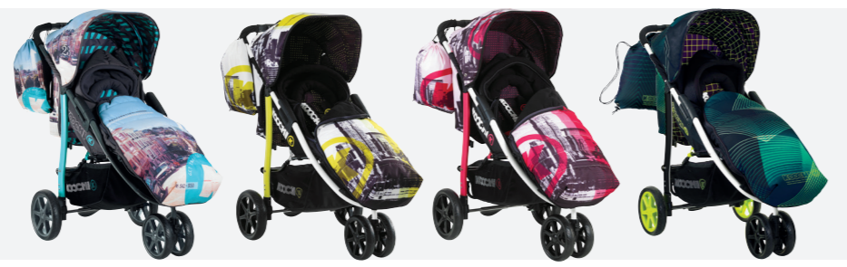
>>SAN FRAN >>BROOKLYN AM >>BROOKLYN PM >>GREEN HYPERWAVE