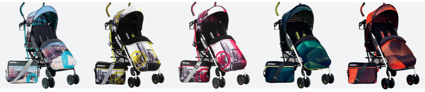
>>SAN FRAN >>BROOKLYN AM >>BROOKLYN PM >>GREEN HYPERWAVE >>ORANGE HYPERWAVE