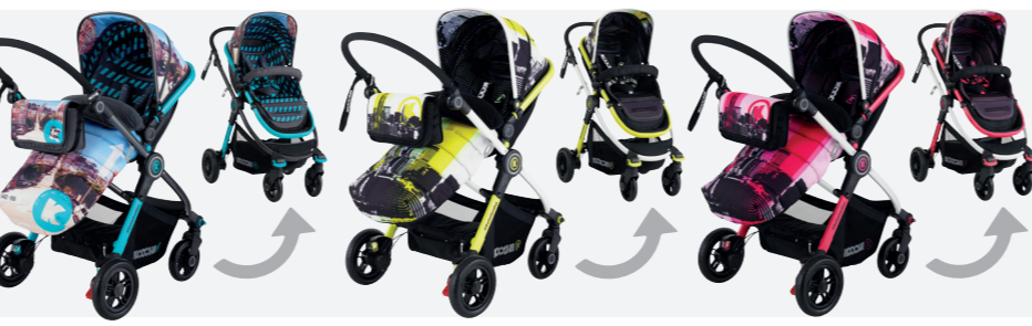
>>SAN FRAN >>BROOKLYN AM >>BROOKLYN PM