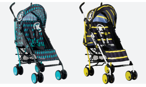
>>TICKET >>PRIMARY YELLOW